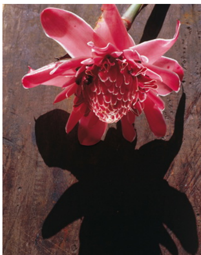
Zenzero della torcia